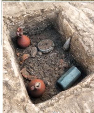
Enclos avec petit monument funéraire, cliché Virginie Archimbeau, Inrap.