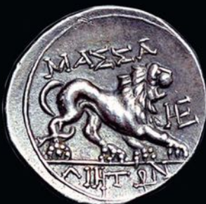
Le lion des monnaies de Marseille