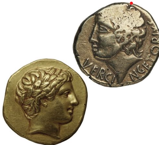
Statère aux types de Philippe II de Macédoine (IV e siècle av. J.-C.) et statère au nom de Vercingétorix, I er siècle av. J.-C., cliché Sylvia Nieto-Pelletier.

Sylvia Nieto-Pelletier, directrice de recherche au CNRS, directrice-adjointe IRAMAT