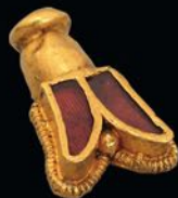
L'abeille de Childéric I er