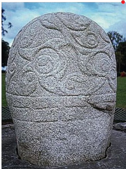
Pierre de Turoe, I er siècle av. J.-C. / I er siècle ap. J.-C. (?).

Conférence en partenariat avec le Site archéologique Lattara – musée Henri Prades