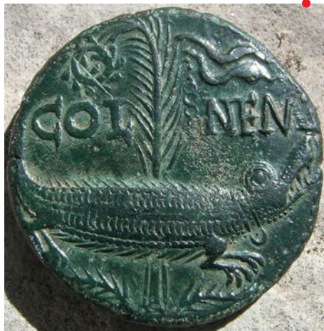
Monnaie romaine frappée à Nîmes, revers, fin du 1 er siècle av. J.-C.

Le Musée de la Romanité, inauguré le 2 juin 2018, propose une découverte de l'histoire de l'homme sur le territoire de Nîmes et de sa région, depuis le début de l'âge du Fer jusqu'à la fin du Moyen Âge. Quelle place l'Antiquité occupe-t-elle dans le discours et dans la présentation muséographique de ce nouvel établissement créé pour conserver, diffuser et mettre en valeur les collections archéologiques nîmoises ? Si l'empreinte laissée dans la cité de Nemausus par les siècles de l'Empire romain est tellement puissante qu'elle a forgé l'identité de la ville contemporaine, des références à d'autres cultures du monde méditerranéen (grecque, étrusque...) n'en sont pas moins perceptibles, à des degrés divers.