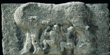
La louve romaine des arènes de Nîmes