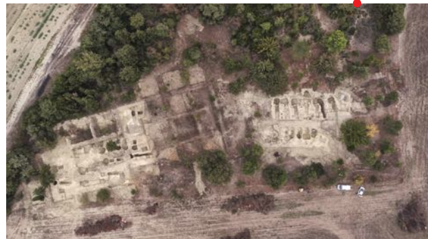
Aléria (Haute-Corse), vue des tombes à chambre de la nécropole de Casabianda, plan-photo drone, P. Valéry – crédits MC/Drac Corse 2017.

Federica Sacchetti , DRAC Paca – service régional de l'archéologie