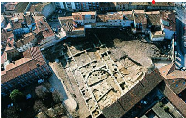
Grand bâtiment de l'hôpital Larray à Toulouse, R. De Filippo, Inrap.

Conférence en partenariat avec le Musée Fabre