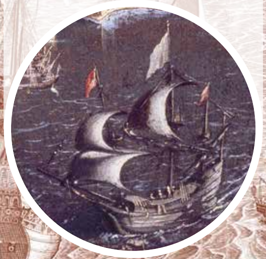
Alessandro Baratta, Vue de Naples , 1629. Gravure. Paris, BNF, département des Estampes (détail)

Naples est une ville côtière. Pendant le 17 ème siècle, les échanges maritimes lui permettent de se développer à la fois culturellement et commercialement.