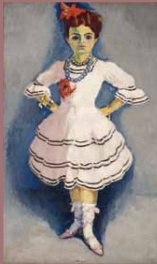
Danseuse espagnole, Kees Van Dongen, 1914 © ADAGP 2011