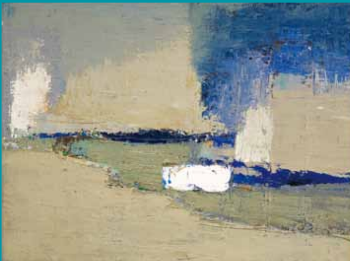
Ménérbes, Nicolas de Staël, 1954 © ADAGP 2011