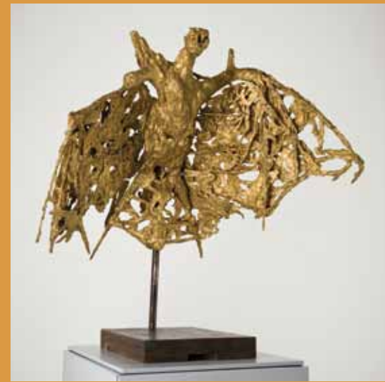
La Chauve-souris, Germaine Richier, 1946 © ADAGP 2011