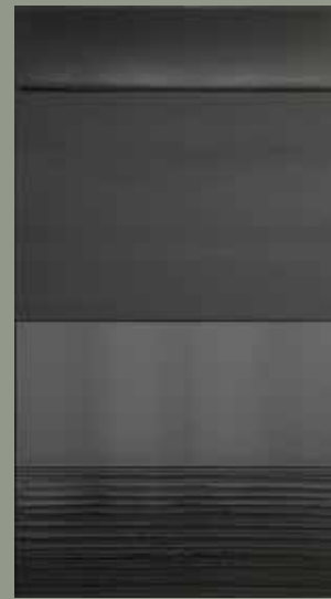
Peinture, 324 x 181 cm, 17 mars 2005, Pierre Soulages, 2005 © ADAGP 2011