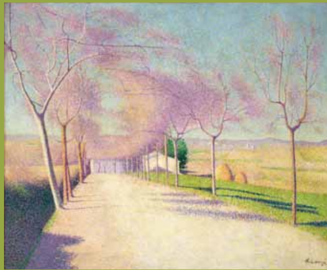
La route au lieu dit de l'Horit, Achille Laugé, vers 1896-1898