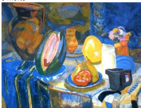
Robert Delaunay (1885-1941) Nature morte portugaise , 1915, Détrempé sur toile, H. 0,855 ; L. 1,080

Composition de l'étalage du marchand, exemple d'interprétation de toile.