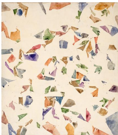
HANTAÏ Simon (Biatorbágy, 1922 - Paris, 2008), Blanc , 1974, Huile sur toile, H. 2,360 ; L. 2,080

Composition de la salade de fruits, exemple Interprétation d'œuvre.