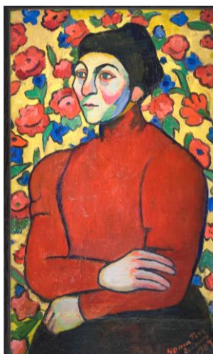
Sonia DELAUNAY (1885-1979) Philomène , 1907, huile sur toile, H. 0,92 ; L. 0,545