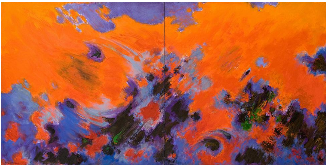
Le Grand incendie, huile sur toile, dyptique, 260,5x130, 1977, Musée Fabre

Dossier Pédagogique (Service éducatif, I.SOBCZAK, A.ROLLAND)