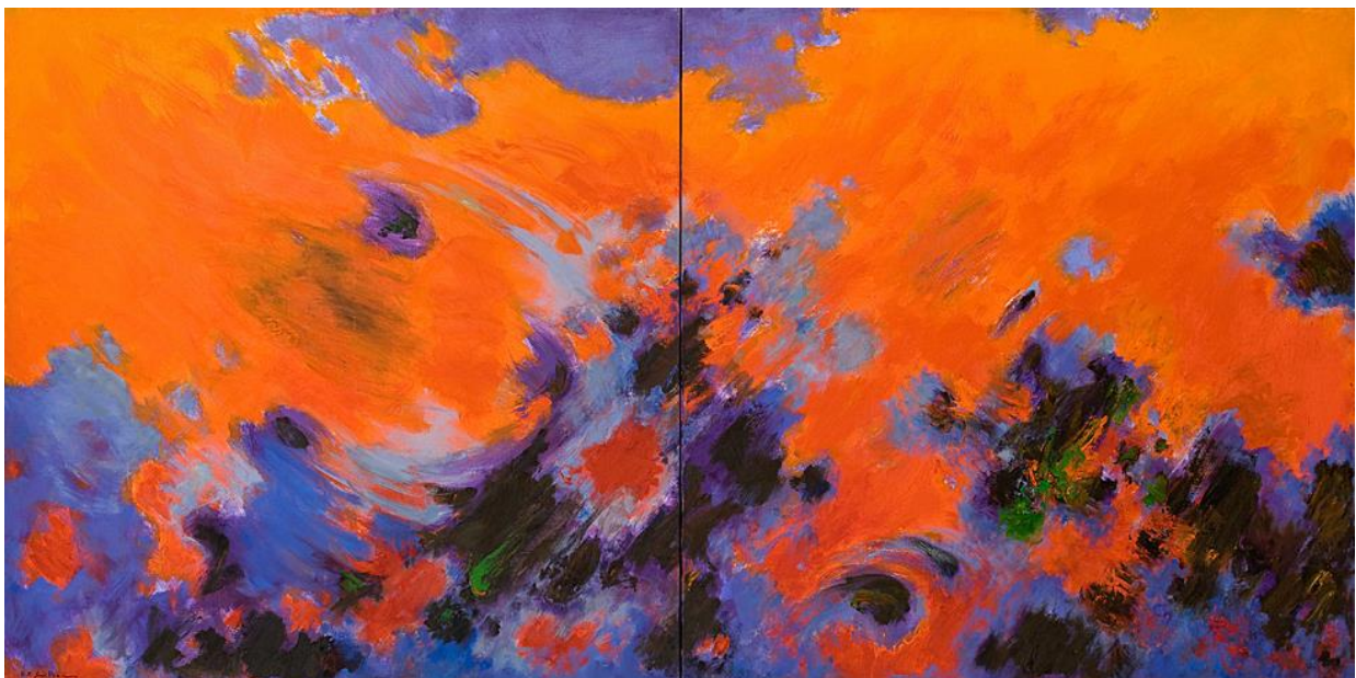
Le Grand incendie , huile sur toile, dyptique, 260,5 x 130 cm, 1977, Musée Fabre, don en 2005 par la famille

Son œuvre est constitué d'aquarelles, de lavis, de gouaches, de décorations murales, de lithographies, de vitraux, d'illustrations de livres, de peintures à l'huile.