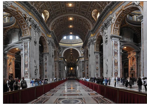
la basilique Saint Pierre à Rome

Jules II (1503-1513) décide de détruire puis de reconstruire la basilique Saint-Pierre en faisant appel aux meilleurs architectes du temps : (Donato di Angelo di Pascuccio dit) BRAMANTE (1444-1514), (Michelangelo di Lodovico Buonarroti Simoni dit)MICHEL-ANGE (1475-1564) et (Gian Lorenzo Bernini, dit)Le BERNIN (1598-1680) . Les travaux commencés en 1506 ne s'achèvent qu'au cours du XVII e siècle. Urbain VIII inaugure la nouvelle basilique en 1626.