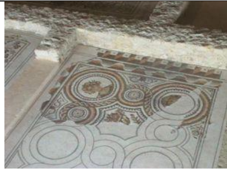
Villa Loupian V e siècle 4