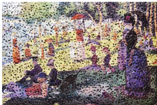
Vik MUNIZ A Sunday on La Grande Jatte, after Georges Seurat Gordian Puzzles 2009

L'héritage de la technique divisionniste se retrouve dans cette toile de Julio Le Parc. Cet artiste argentin oriente son travail vers des recherches sur la lumière, sur le mouvement et sur la couleur. Les résultats de ses études et les créations qui en résultent lui valent d'être le précurseur de l'art cinétique - mise en mouvement d'une œuvre d'art dans l'espace. Initiateur de l'Op Art et fondateur du Groupe de Recherche d'Art Visuel, Le Parc est une figure majeure de l'histoire de l'art contemporain. Il s'intéresse aussi au rapport entre l'œuvre et le spectateur - ou art perceptuel - thématique également très contemporaine. Il semble ici vouloir troubler le spectateur avec des jeux de couleurs, de touche et de lumière. La technique pointilliste de Signac trouve ici un bel héritage, la touche vient en effet révéler avec puissance les couleurs de la toile.