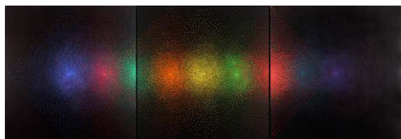
Julio Le Parc Alchimie 218 Triptyque 200 x 600 1996

En fin d'exposition, retrouvez les œuvres suivantes :