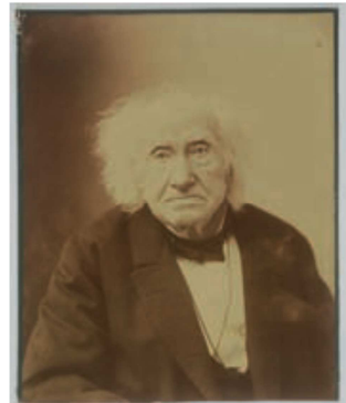
Nadar, Portrait d'Eugène Chevreul , Photographie (tirage) Bibliothèque centrale du Muséum d'Histoire Naturelle, Paris © Bibliothèque centrale MNHN, Paris 2013.

Pour composer ses tableaux, Paul Signac ne fait de mélange ni sur sa palette, ni sur sa toile. Il juxtapose méticuleusement des touches de couleurs pures les unes à côté des autres. C'est l'œil du visiteur qui mêle les couleurs. On appelle cela le mélange optique.