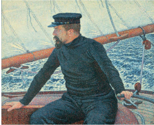
Théo Van Rysselberghe, Signac sur son bateau , 1896, Collection particulière