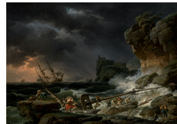
Claude-Joseph Vernet, Tempête avec naufrage , 1770, huile sur toile, Munich, Bayerische Staatsgemäldesammlungen - Alte Pinakothek, © BPK, Berlin, Dist.RMN - Grand Palais/image BSGS.

Un artiste magicien sait élever au rang de l'art la réalité banale. Chardin parvient à magnifier les objets du quotidien par sa manière de poser la couleur sur la toile. Vernet rend justice aux plus subtiles nuances d'atmosphère des paysages maritimes qu'il transforme en théâtre du Sublime. Hubert Robert révèle la fragilité des civilisations dans ses paysages de ruines mélancoliques.