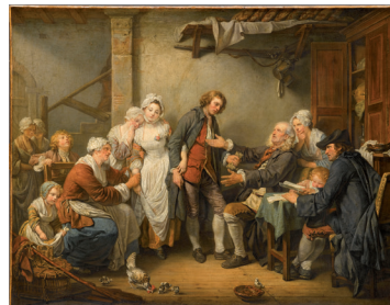
Jean-Baptiste Greuze, L'Accordée de village , 1761, huile sur toile, Paris, Musée du Louvre, département des Peintures, Collection de Louis XVI (acquis en 1782) © RMN-Grand Palais (musée du Louvre) / Franck Raux.

Quant aux sculpteurs : Allegrain et Lemoine, ils doivent se jouer des contraintes de la matière pour approcher la vérité des corps.