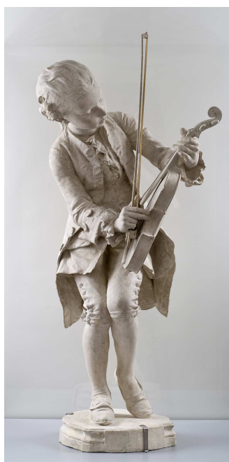
Louis Ernest BARRIAS (1841 – 1905) Mozart enfant , 1883 Plâtre

Les Sens en éveil est un parcours sensible qui propose aux élèves de vivre une expérience sensorielle. La proposition de visite consiste, en quelque sorte, à « regarder avec les oreilles et écouter avec les yeux » : les sensations sont privilégiées et les élèves sont invités à les mettre en mots.