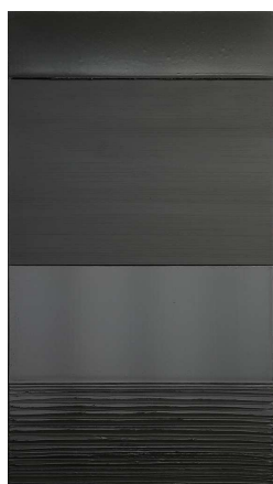
Pierre Soulages (Rodez, 1919) Peinture 324x181 cm, 17 mars 2005 huile sur toile

Pierre Soulages évacue toute référence à la figuration ou à l'anecdote, il se consacre uniquement à la matière de la peinture et à la lumière, tout en employant le noir. Il travaille le noir comme un matériau qui révèle la lumière. En 1979, il crée ses premières peintures monopigmentaires, appelées « outrenoir ». Avec ses outils, large brosse plate, spatule, couteau, il module l'épaisseur de la matière, épaisse couche de noir ductile, joue sur les plages lisses et les plages striées, sur les ombres et les reflets mêlés qui s'accrochent aux multiples sillons creusés dans la pâte. Par opposition, les surfaces écrasées, lissées, apportent une couleur et une lumière différentes. Le peintre compose, telle une partition, à partir d'une variété de rythmes : intervalles, alternances, reprises successives, répétitions. Le Polyptyque F témoigne de ce travail de façon exemplaire.