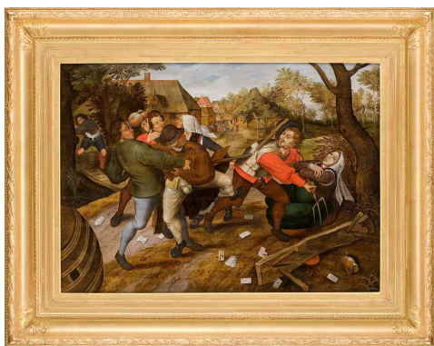
Pieter Brueghel Le Jeune (Bruxelles, 1564/65 – Anvers, 1637/38) Rixe de paysans , 1620 huile sur bois

Pieter Brueghel le jeune a exécuté une dizaine d'exemplaires de cette composition, chacun avec des formats différents et montrant des variantes. Il s'agit de copies d'après un tableau aujourd'hui disparu de son père Pieter Brueghel l'Ancien (1520/25 ?-1569). Le tableau illustre le plus clair de la production de cette célèbre dynastie de peintres flamands : la scène de genre populaire, baignée dans une ambiance moyenâgeuse et animée par des groupes de villageois bruyants, à la trogne rustique, qui accaparent toute l'attention du spectateur. Au-delà du sujet, la composition est animée par tout un jeu de raccourcis créant de surprenants effets de perspective, par les accords des sourdes surfaces colorées et par l'éparpillement rythmique des personnages.