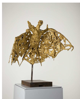
Germaine Richier (Grans, 1902 – Montpellier, 1959) La Chauve-souris, 1946 bronze naturel nettoyé

Hans Zimmer, né en 1957 à Francfort, est un compositeur de musiques de films dont il marque l'histoire en alliant musique électronique, orchestrale et l'utilisation des chœurs. Installé aux Etats-Unis, il devient célèbre dans le domaine des musiques de films d'action hollywoodiens. Barbarian hordes est extrait de la bande originale du film Gladiator de Ridley Scott, musique avec laquelle il connaît l'un de ses plus importants succès en 2000.