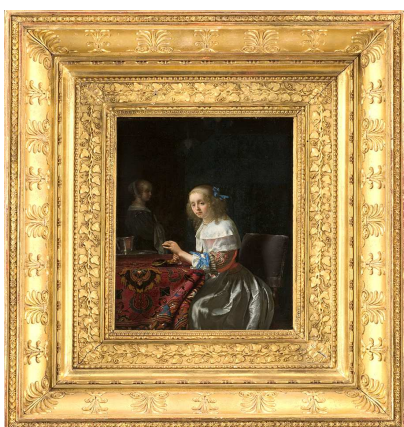
Frans van Mieris L'Ancien (Leyde 1635– Leyde 1681) L'Enfileuse de perles , 1658 huile sur bois

Malicorne est un groupe français de musique folk fondé en 1973. En faisant appel à des instruments traditionnels et parfois rares, comme le cromorne, l'épinette des Vosges, la vielle à roue, il recrée la magie des vieilles mélodies. Le groupe compose en s'inspirant des musiques traditionnelles françaises, la musique du Moyen-âge ou la musique celtique. Bourrée, Scottish valse est un air extrait de l'album Le Mariage anglais , 1975.