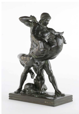
Antoine-Louis Barye (Paris, 1796 – Paris, 1875) Thésée combattant le Minotaure, 1874 (1 ère édition 1857), bronze

Antoine-Louis Barye, célèbre pour ses sculptures animalières, est l'un des tous premiers artistes romantiques du XIXe siècle. Il choisit de représenter le combat héroïque de Thésée et du Minotaure, thème traité par les artistes depuis la plus haute Antiquité, en restituant avec un puissant réalisme la lutte entre les deux êtres : le détail des griffes du monstre, labourant la chair de Thésée en est un brillant exemple. Le modelé du corps de la bête qui révèle la puissance de sa musculature, contraste avec le corps du héros qui s'inscrit dans la droite ligne du style grec archaïque. De la même manière, le héros campe solidement sur ses deux jambes, et, dominant le monstre, s'apprête à l'achever. L'affrontement de l'homme et du monstre, la bestialité de la lutte, sont des thèmes caractéristiques du mouvement Romantique du XIXe siècle.