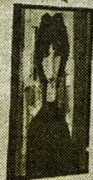
Deux toiles de Fournel : un coin de Castelnaud et un portrait.