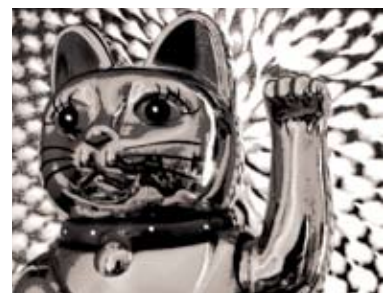
Œuvre de Chris Marker