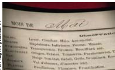
© Courtesy Gallery Vasistas, Mtp Cédrick Eymenier. Videostill du film Within These Walls , musique de Damon & Naomi. 2008.