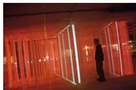
Installation vidéo sonore « 3 DESTRUCT »

14 rue de l'école de Pharmacie – 34000 Montpellier