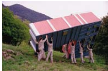
Saltar per l'aire , 2007 - DVCAM - 5 minutes

■ Du 21 novembre 2008 au 7 février 2008 : exposition « Saltar per l'aire » de Daniel Chust Peters