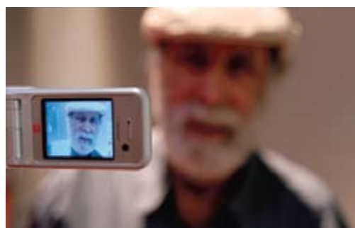
Œuvre de Marcel Hanoun

Diverses projections sont également proposées à la médiathèque d'Agglomération Federico Fellini :