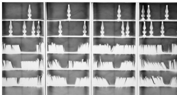
ill 2- Sculptures d'ombre Création de Claudio Parmiggiani en 2002 avant la réhabilitation du lieu pour son intégration au musée Fabre

Au premier étage se trouvait la bibliothèque, considérablement enrichie par la donation Fabre de 9000 volumes, dont le fonds Vittorio Alfieri, poète italien qu'il avait fréquenté à Florence. La salle de lecture ouvrait sur un cabinet de médailles installé dans le pavillon est. Les murs tapissés de vitrines présentaient de petits objets précieux ayant appartenu à Fabre (certaines de ces œuvres sont présentées dans la vitrine dédiée aux donateurs du musée, salle 12). Dans la salle publique, des escaliers en spirale disposés dans les angles permettaient d'accéder à une galerie en bois placée sur le pourtour de la pièce qui accueillait les ouvrages précieux. Cet aménagement en bois a perduré tout le xx e siècle, jusqu'aux interventions de Georges Rousse et Claudio Parmiggiani en 2002 pendant le chantier de restructuration (ill.2).