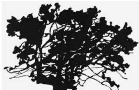
Alexandre HOLLAN (Budapest, 1933) Le Déchêne Grand Chêne , 2012, © Musée Fabre de Montpellier Méditerranée Métropole - photographie Frédéric Jaulmes.