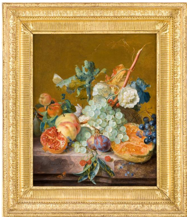
HUYSUM Jan van (Amsterdam, 1682 - Amsterdam, 1749)