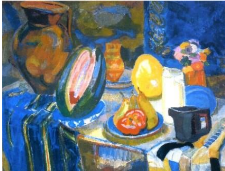
Robert DELAUNAY (1885-1941), Nature morte portugaise , 1915, Détrempe sur toile, H. 0,855 ; L. 1,080