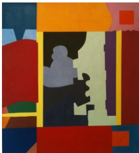
- Jaffe SHIRLEY, The Juke Box , 1976, Huile sur toile, Galerie Jean Fournier, Paris

Composition de la salade de fruits, exemple Interprétation d'œuvre.