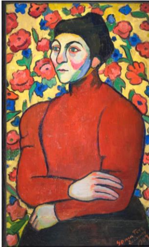
Sonia DELAUNAY (1885-1979) Philomène , 1907, huile sur toile, H. 0,92 ; L. 0,545