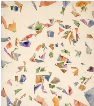
HANTAÏ Simon (Biatorbágy, 1922 - Paris, 2008), Blanc , 1974, Huile sur toile, H. 2,360 ; L. 2,080