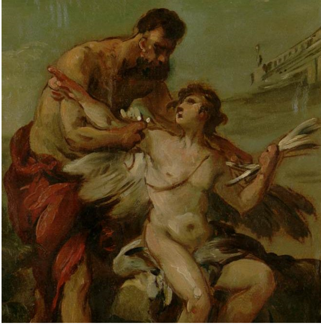
Joseph-Marie Vien, Dédale et Icare , Huile sur papier marouflé sur bois

Sa rencontre décisive avec le Comte de Caylus, amateur passionné d'antiques, convertit Vien au néoclassicisme. De 1755 à 1765, les deux hommes s'efforcent de faire revivre dans la peinture contemporaine l'élégance linéaire et la simplicité d'esprit de l'Antiquité. Dans cette entreprise, Caylus sera la tête et Vien la main : La Marchande d'Amour ou le Dédale et Icare en sont le fruit.