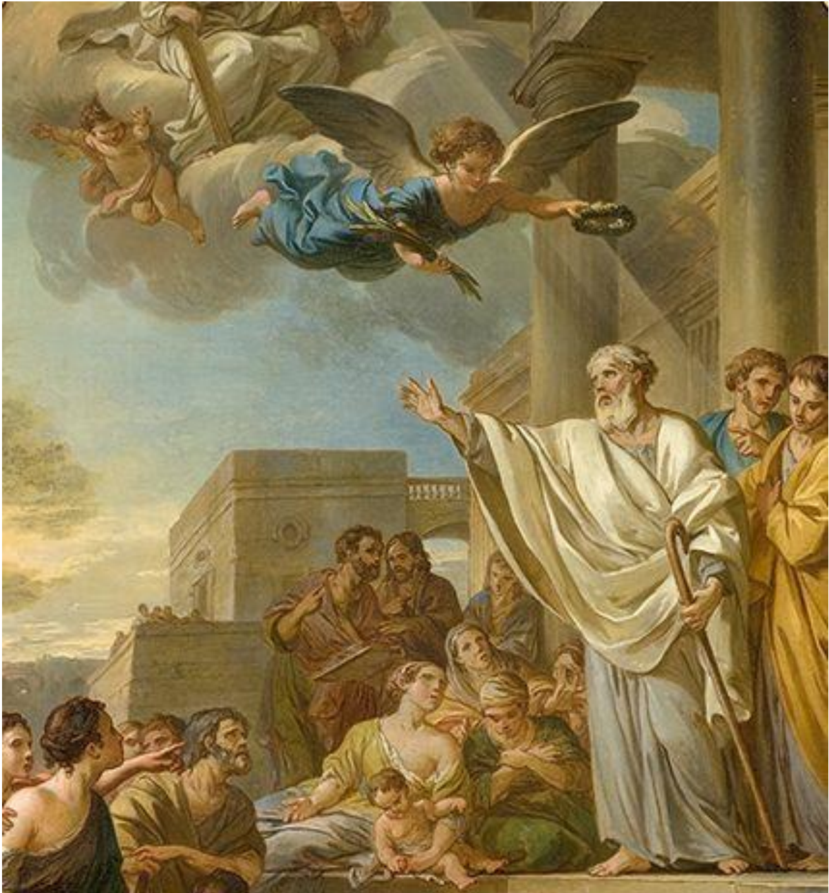
Joseph-Marie Vien, Saint Denis prêchant la Foi en France , esquisse, 1767

Vien occupe une place centrale dans le renouveau du goût pour l'antique qui traversa les arts en France du milieu du XVIIIe jusqu'au XIXe siècle, mouvement que l'on qualifie aujourd'hui de néoclassique. Au début de sa carrière, la peinture française est marquée par le style « rocaille », ce « goût frivole qui dégénéra bientôt en une espèce de mode » selon les mots de Vien. La peinture rocaille de Boucher, Natoire, ou Van Loo, privilégiait les scènes mythologiques à connotation libertine, les compositions en arabesques et les couleurs sophistiquées.