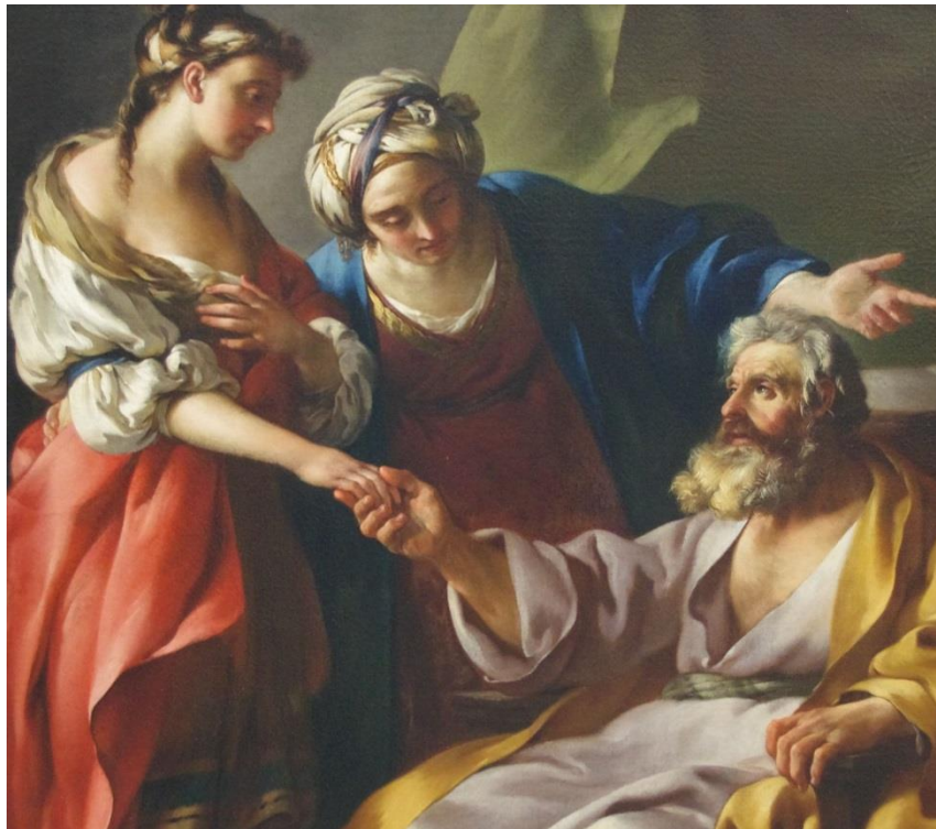
Joseph-Marie Vien, Sarah présentant Agar à Abraham , 1749, Huile sur toile

L'artiste insiste fortement sur ce point dans ses Mémoires , se présentant comme un peintre sans culture, mais dont la naïveté lui permet de ne pas succomber aux artifices de la rocaille. C'est de la tradition italienne de la Renaissance et du XVIIe siècle que se réclame le jeune homme ( Sarah présentant Agar ).