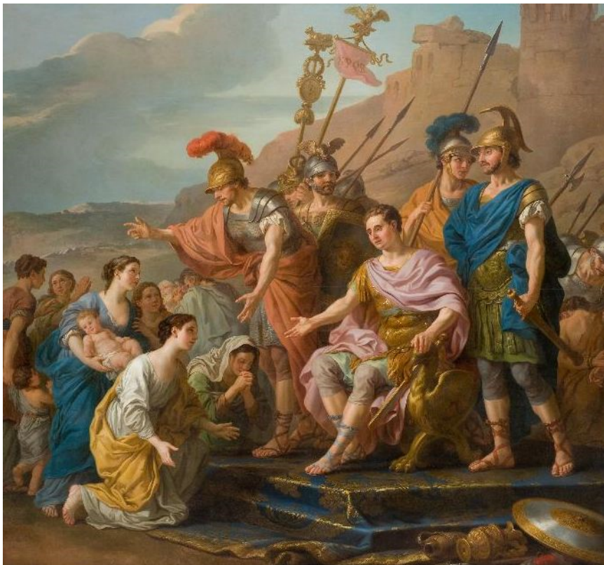
Joseph-Marie Vien, La famille de Coriolan venant le fléchir et le détourner d'assiéger Rome , après 1771

La période néoclassique se caractérise également par l'émergence d'un véritable public de l'art, grâce à l'exposition du Salon au Louvre, confrontant les peintures de Vien à l'appréciation directe des critiques. L'administration royale se convainc dès lors des facultés morales et éducatrices de l'art et encourage la représentation de sujets mettant en scène les exemples de vertu. Vien contribue à ces grandes commandes ( Saint Louis , Coriolan ) tandis que le Saint Denis prêchant la foi est un jalon fondamental du renouvellement de la peinture religieuse jusqu'au XIXe siècle.