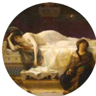
salle n°35 Alexandre Cabanel, Phèdre , 1880