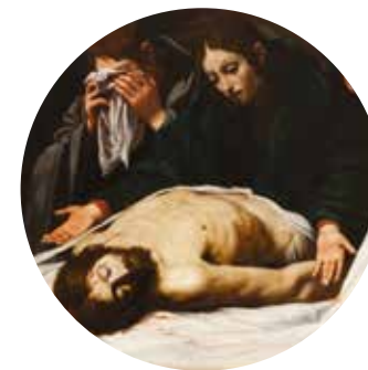
salle n°11 Leonello Spada, Lamentation sur le Christ mort , avant 1615