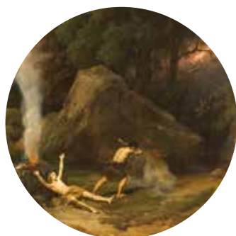
salle n°30 Jean-Charles Joseph Remond, La Mort d'Abel. Paysage historique , 1838