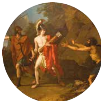
salle n°18 François-Xavier Fabre, Ulysse et Néoptolème enlevant à Philoctète les flèches d'Hercule , 1800