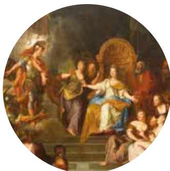
salle n°18 Antoine Coypel, Enée et Achate apparaissant à Didon , vers 1715-1717