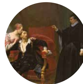
salle n°30 Raymond-Auguste-Quinsac Monvoisin, La Mort de Charles IX , 1834