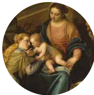
salle n°9 Paolo Caliari, dit Véronèse, Le Mariage mystique de sainte Catherine , 1560-1565

Certaines oeuvres peuvent être temporairement prêtées pour une exposition. Leur absence est alors annoncée sur le site du musée Fabre.