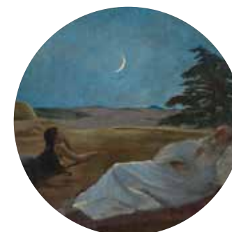
salle n°39 Frédéric Bazille, Ruth et Booz , vers 1870