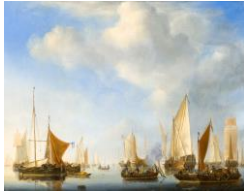
VAN DE VELDE, Willem Marine , 1657