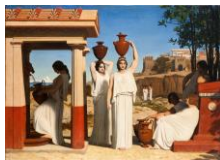
PAPETY, Dominique Femmes à la fontaine , 1839