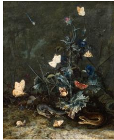
VAN SCHRIECK, Otto Marseus Sous bois avec papillon autour d'une tige de chardon , 1667