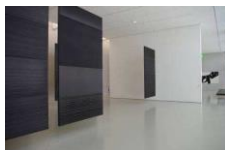
Collection Pierre SOULAGES

Cet audioguide vous invite à partager les commentaires sur des œuvres choisies par des détenus de la Maison d'Arrêt de Villeneuve-lès-Maguelone, dans le cadre du projet Le Musée Citoyen , en partenariat avec le Service de Probation et d'Insertion Pénitentiaire de l'Hérault.