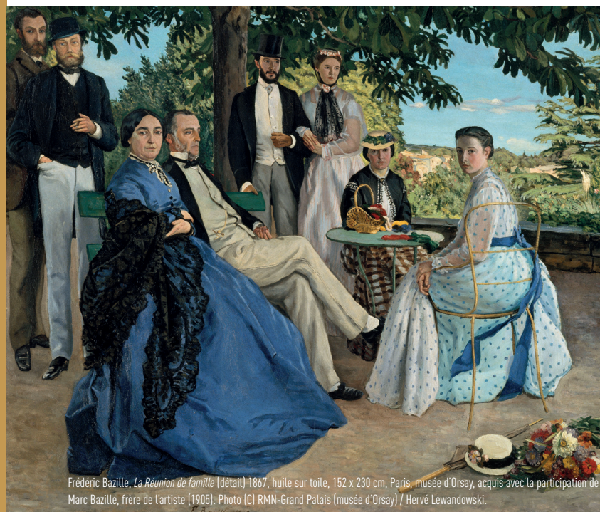
Frédéric Bazille, La Réunion de famille (détail) 1867, huile sur toile, 162 x 230 cm, Paris, musée d'Orsay, acquis avec la participation de Marc Bazille, frère de l'artiste (1905).

Une exposition internationale, trois étapes prestigieuses : le musée Fabre à Montpellier, le musée d'Orsay à Paris et la National Gallery of Art à Washington.