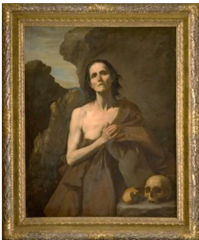
Jusepe de Ribera, Sainte Marie l'Egyptienne , 1641, Huile sur toile, 132x108 cm.

Le musée Fabre, lieu de rencontre sensible avec l'art, participe pleinement à la culture de la sensibilité. L'exposition « L'âge d'or de la peinture à Naples » constitue quant à elle un moment privilégié pour initier une éducation à la sensibilité. En effet, les œuvres exposées témoignent de l'évolution de la peinture napolitaine tout au long du XVII ème siècle entre « un naturalisme expressionniste et tragique et un goût baroque et sensuel pour la couleur et le mouvement ». Par ailleurs, l'exposition revient sur les liens entre l'art et l'histoire mouvementée de Naples: éruption du Vésuve en 1631, révolte de Masaniello en 1647, peste de 1656, autant d'émotions populaires.