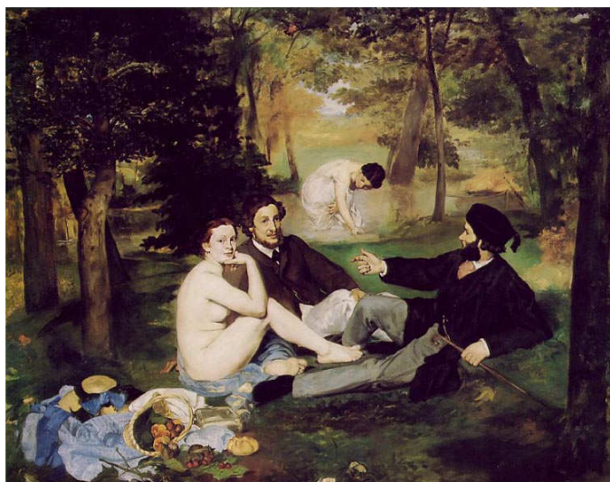
Edouard Manet le déjeuner sur l'herbe 1862-63, musée d'Orsay, Paris