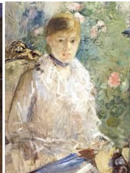
tablèu n° 3