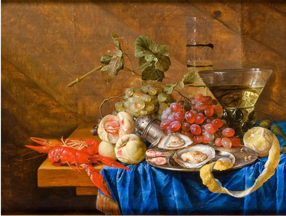
Una natura mòrta

Pòdes nomenar tres fruchas presentas sul tablèu ?