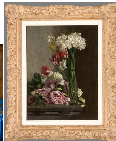
tablèu n° 5