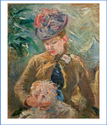
Cornelis de HEEM