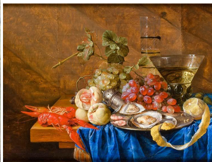
tablèu n° 4