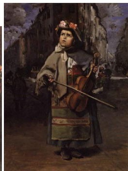
tablèu n° 2