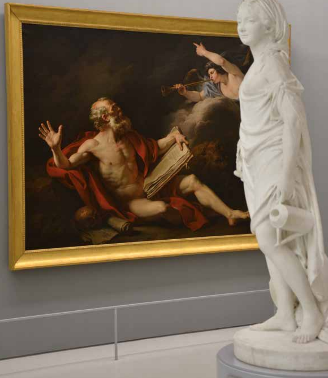
Vue des salles des collections permanentes, juillet 2014, musée Fabre de Montpellier Agglomération