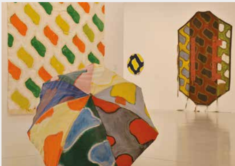
Vue de l'exposition Viallat-une rétrospective , juillet 2014, musée Fabre de Montpellier Agglomération, cliché musée Fabre de Montpellier Agglomération © ADAGP, Paris 2014