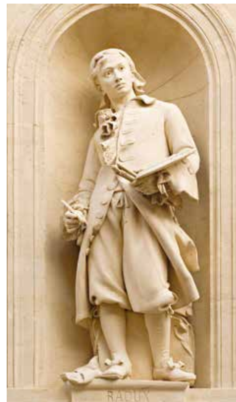
Musée Fabre de Montpellier Agglomération