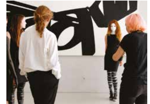
Les petites robes noires, Lycée Hemingway de Nîmes, Filières Design et Mode

Pour participer, merci de prendre contact à l'adresse suivante m.gaquerel@montpellier-agglo.com