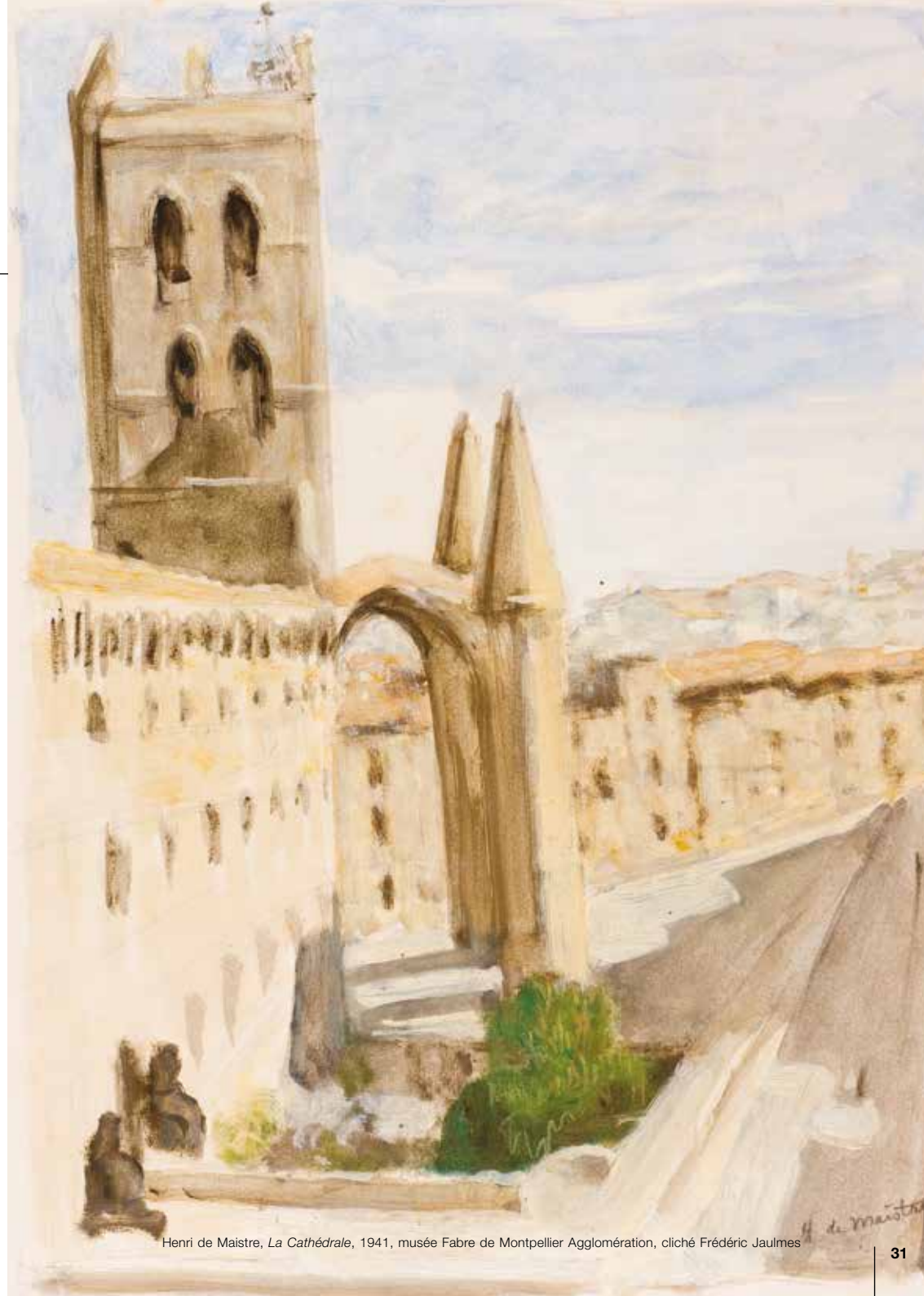
Henri de Maistre, La Cathédrale , 1941, musée Fabre de Montpellier Agglomération