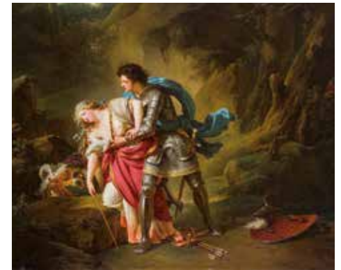
François-André Vincent, Renaud et Armide , vers 1787, musée Fabre de Montpellier Agglomération

Le musée Fabre, qui a proposé l'hiver dernier une rétrospective consacrée à François-André Vincent, conserve dans son fonds six de ses toiles. Cette nouvelle acquisition vient enrichir, de façon marquante, son exceptionnelle collection néoclassique.