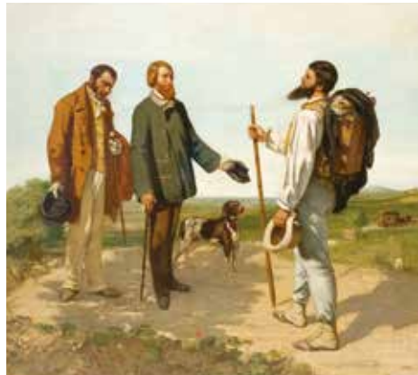
Gustave Courbet, La Rencontre , 1854, musée Fabre de Montpellier Agglomération