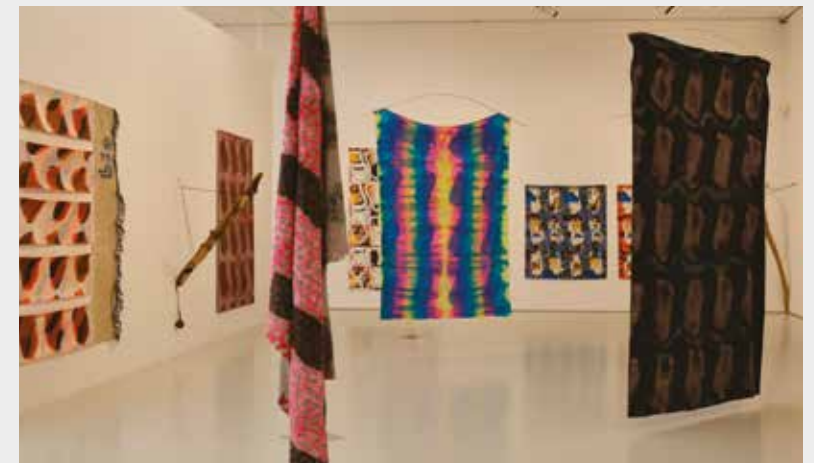
Vue de l'exposition Viallat-une rétrospective, juillet 2014, musée Fabre de Montpellier Agglomération

Il est conseillé de retirer ses billets à l'avance à l'accueil du musée. En raison de l'âge des enfants, le nombre des participants est limité à 10 enfants afin de favoriser le confort des visites.