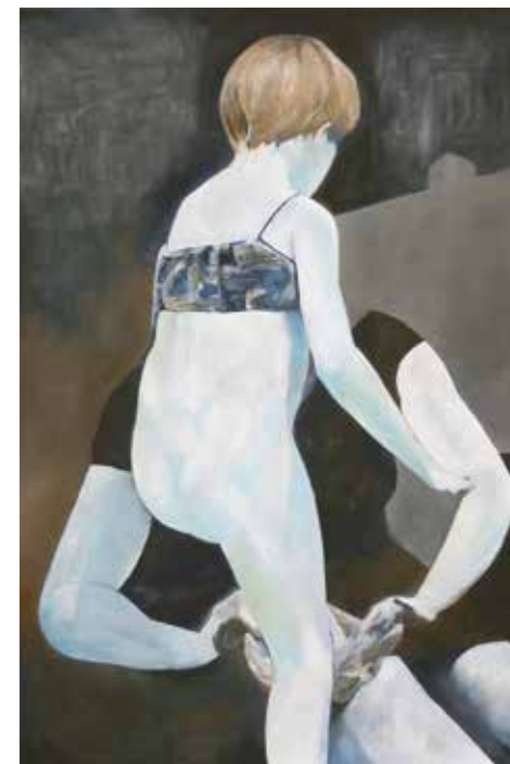
Mélanie Lefebvre , Back , huile sur toile, 150x230 cm, 2013

Ours est un film dévoilant l'intimité d'un agent forestier, ses gestes, ses parcours quotidiens et toute la sérénité théâtrale inhérente.