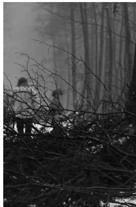
Laura Laby , Ours , installation vidéo HD 1920x1080, 5 min, 2012

Un assemblage de vidéo et de sculpture relate des comparaisons de chasse au crocodile par des africains et des occidentaux.