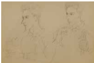
Jean Hugo, Double portrait de Jean Cocteau , 1923, musée Fabre de Montpellier Agglomération, cliché musée Fabre de Montpellier Agglomération © ADAGP, Paris 2014

Rencontré en 1912 dans les couloirs du Théâtre des Arts, aux Batignolles, Jean Cocteau devient un ami proche de Jean Hugo. Il lui commande des scénographies de fêtes et des créations pour des spectacles d'avant-garde. Leur véritable collaboration commence en 1921. Jean Hugo réalise les costumes et les masques pour le ballet pantomime Les mariés de la Tour Eiffel , puis en 1924, les décors des costumes de Roméo et Juliette . En 1926, il dessine les décors d' Orphée au Théâtre des Arts. Ce double portrait d'une grande finesse et de belle dimension complète la remarquable collection du musée Fabre.