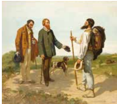
Gustave Courbet, La rencontre , 1854, musée Fabre de Montpellier Agglomération