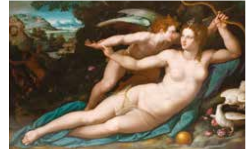
Alessandro Allori, Vénus et l'Amour , 1570, musée Fabre de Montpellier Agglomération

Plein tarif : 8 € Pass'Agglo : 7 € Tarif réduit : 5,50 €