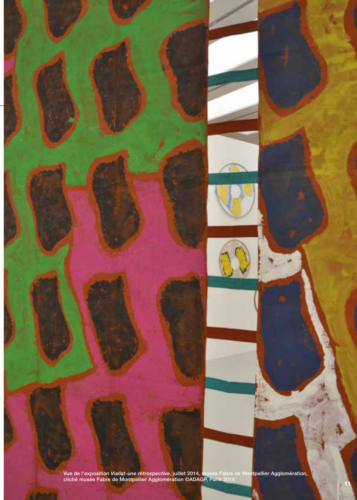
Vue de l'exposition Viallat-une rétrospective , juillet 2014, musée Fabre de Montpellier Agglomération, cliché musée Fabre de Montpellier Agglomération ©ADAGP, Paris 2014