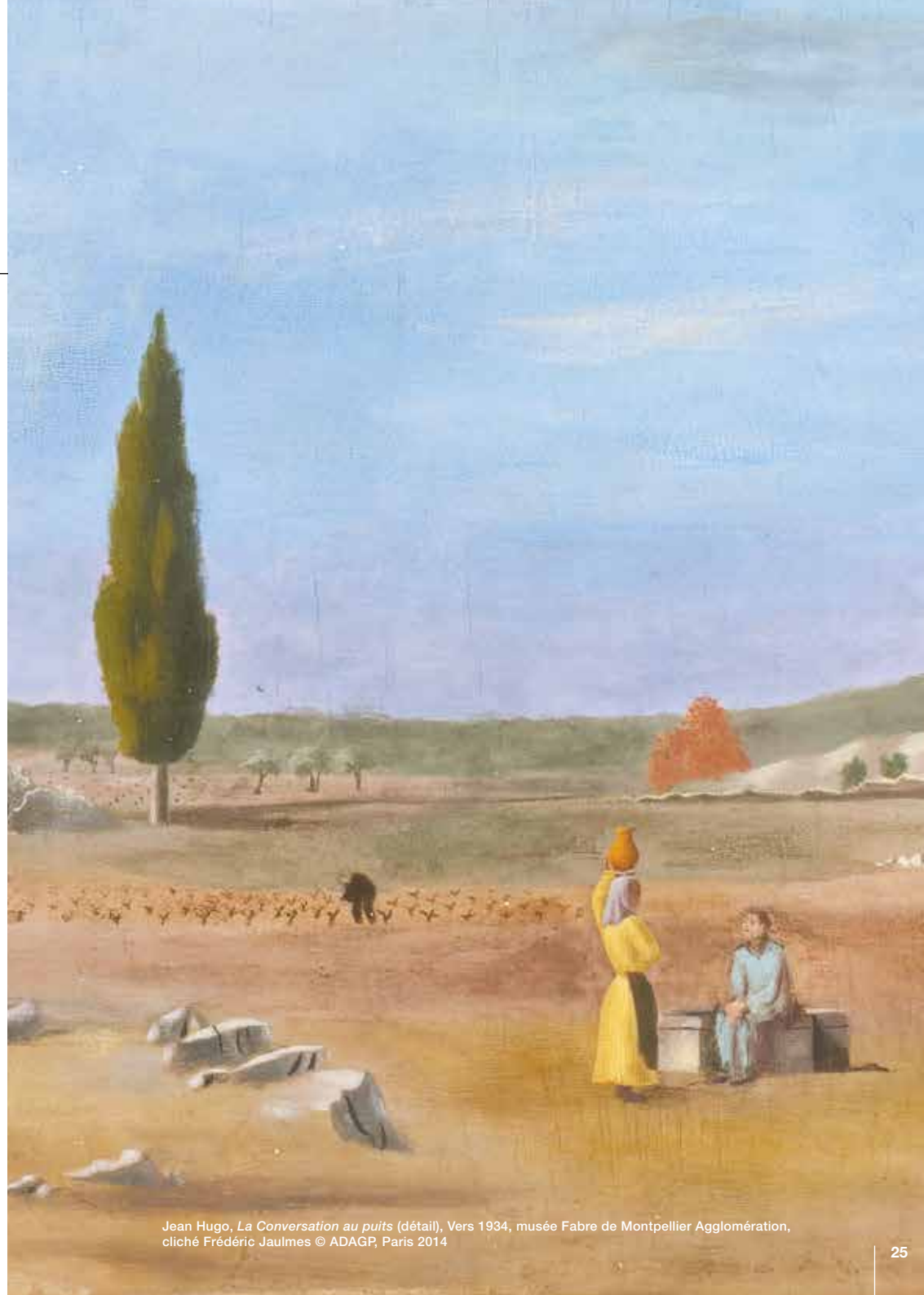
Jean Hugo, La Conversation au puits (détail), Vers 1934, musée Fabre de Montpellier Agglomération, cliché Frédéric Jaulmes © ADAGP, Paris 2014