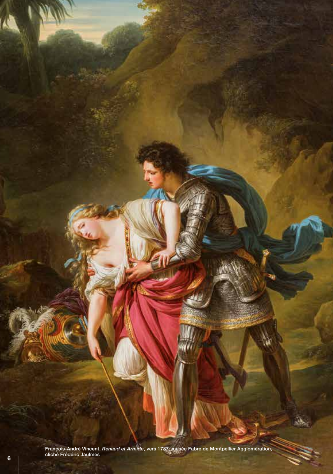
François-André Vincent, Renaud et Armide , vers 1787, musée Fabre de Montpellier Agglomération

2015 sera aussi une année particulièrement riche en expositions avec, durant l'été, Le Siècle d'Or de la peinture à Naples , qui fera écho à sa manière à la mémorable exposition Corps et Ombres en 2012 et, à l'automne, Sénoufo, un art d'Afrique de l'ouest en collaboration étroite avec le musée de Cleveland et sous l'égide de FRAME.