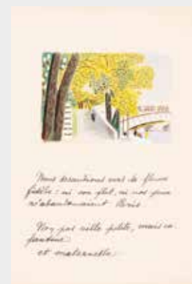
Jean Hugo, Les feuilles libres , mars-avril 1925, 23x18,5 cm, musée Fabre de Montpellier Agglomération, cliché Frédéric Jaulmes © ADAGP, Paris 2014

Atelier à la journée : mardi 17, mercredi 18, vendredi 20 février 2014, de 10h à 12h et de 14h à 16h.