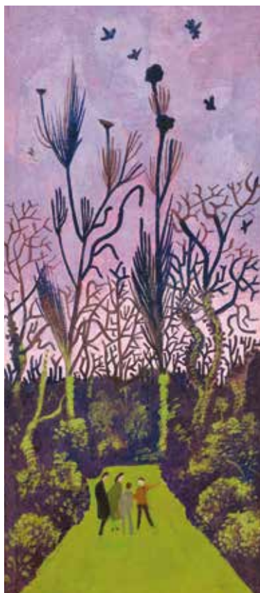
Jean Hugo, Kew Garden, s.d., musée Fabre de Montpellier Agglomération

Au travers de l'utilisation de petits formats à la plume et à la gouache, Hugo explore les possibilités de l'illustration de récits comme dans Voyage à Moscou et à Leningrad , en 1953, An Inland Voyage de Robert Louis Stevenson en 1938, ou dans Sausaye de Maurice Sceve en 1971, présentée dans une suite tirée sur papier Japon.