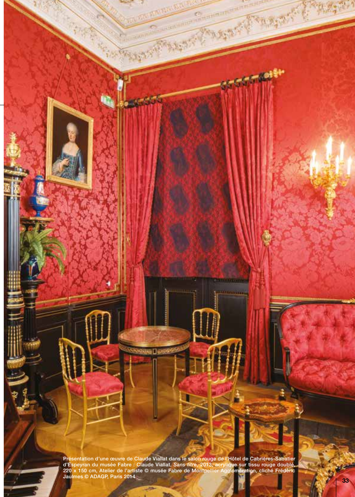
Présentation d'une œuvre de Claude Viallat dans le salon rouge de l'Hôtel de Cabrières-Sabatier d'Espeyran du musée Fabre : Claude Viallat, Sans titre , 2013, acrylique sur tissu rouge doublé, 220 x 150 cm, Atelier de l'artiste © musée Fabre de Montpellier Agglomération, cliché Frédéric Jaulmes © ADAGP, Paris 2014

Tapis, nappes, dessus de fauteuils, dessus de poufs, ombrelles, passementeries... autant de matériaux utilisés depuis toujours par l'artiste, qui trouvent ici un nouveau souffle, se fondant dans le décor tel le majestueux tissu de dentelle disparaissant presque dans les rideaux du Salon Rouge.