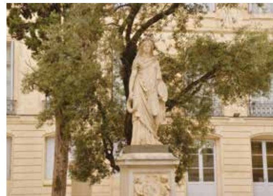
Cour Vien