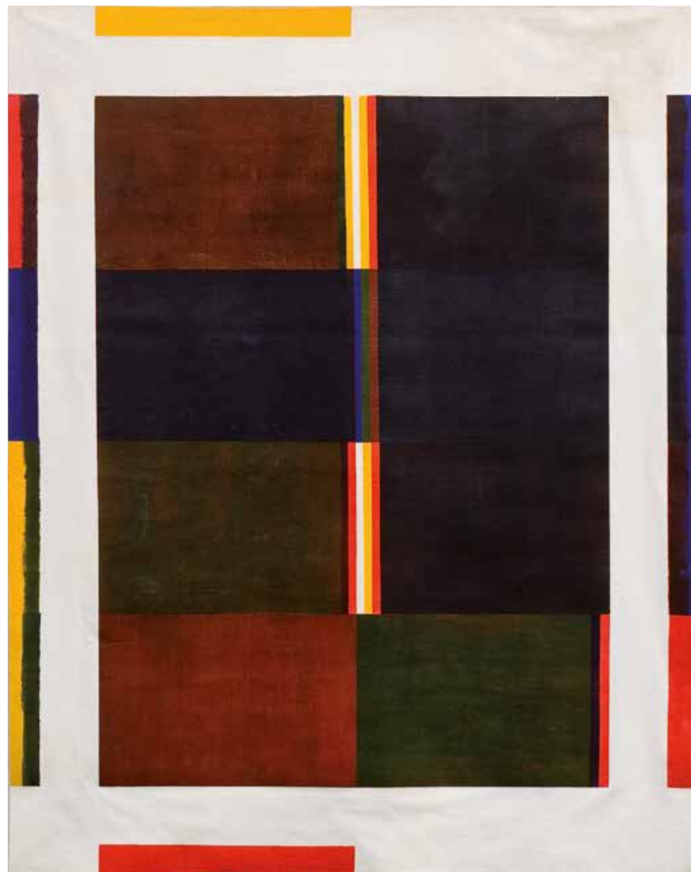
Albert Ayme, Paradigme du bleu-jaune-rouge , s.d., musée Fabre de Montpellier Agglomération

Dimanche 7 décembre 2014 à 15h et à 16h - gratuit