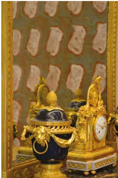
Œuvre de Claude Viallat (1994, acrylique sur toile, Atelier de l'artiste) dans l'Hôtel de Cabrières-Sabatier d'Espeyran, juillet 2014, musée Fabre de Montpellier Agglomération