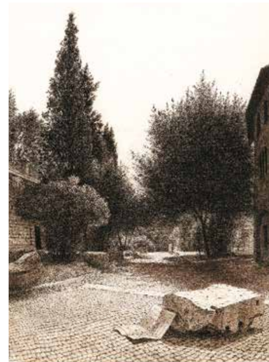
André Castagné, Le Capitole , Août 1981, Pointe noire et fusain sur papier, musée Fabre de Montpellier Agglomération

Bagouet de Montpellier au printemps 2013, permettent de prendre la mesure de ses dons artistiques surprenants - que ce soit au service des sites de la Ville Eternelle qui n'ont cessé de stimuler son imaginaire et sa sensibilité ou de ceux, proches du littoral languedocien, qu'il fréquente depuis son enfance. Ces dessins, d'une composition infallible, d'une écriture minutieuse et acérée, tissent des liens évidents et stimulants avec les artistes néoclassiques du cabinet des Arts graphiques du musée (Fabre, Gauffier, Hackert), eux aussi fascinés par l'Italie.