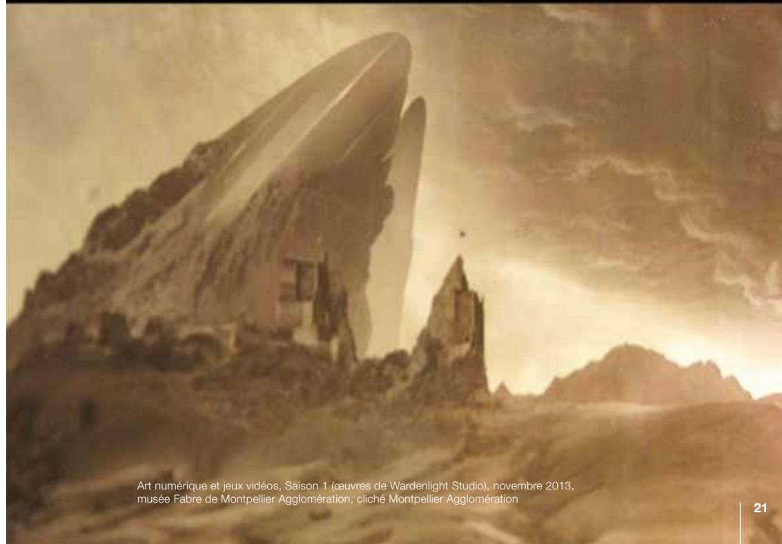
Art numérique et jeux vidéos, Saison 1 (œuvres de Wardenlight Studio), novembre 2013, musée Fabre de Montpellier Agglomération, cliché Montpellier Agglomération