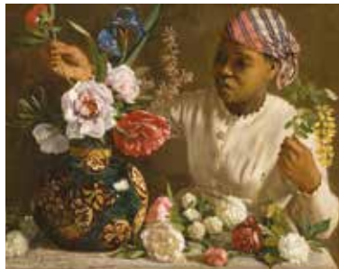
Frédéric Bazille, La Nègresse aux pivoines , 1870, musée Fabre de Montpellier Agglomération, cliché Frédéric Jaulmes