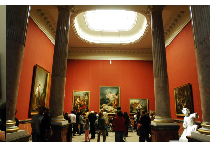
Galerie des colonnes