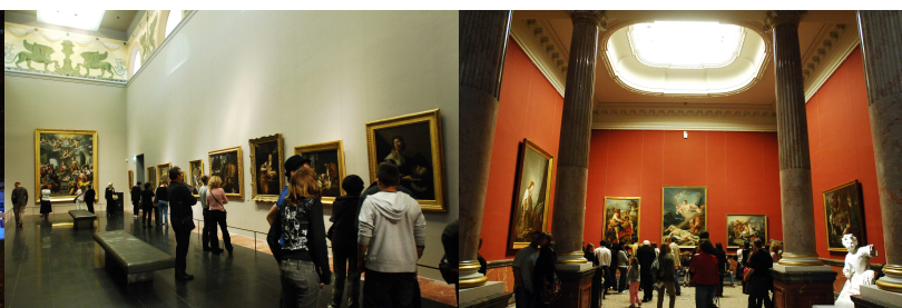
Galerie des griffons