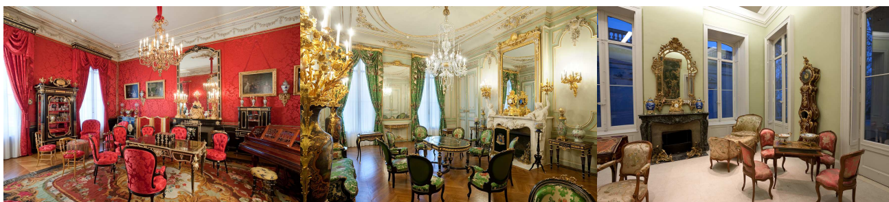
Le salon rouge