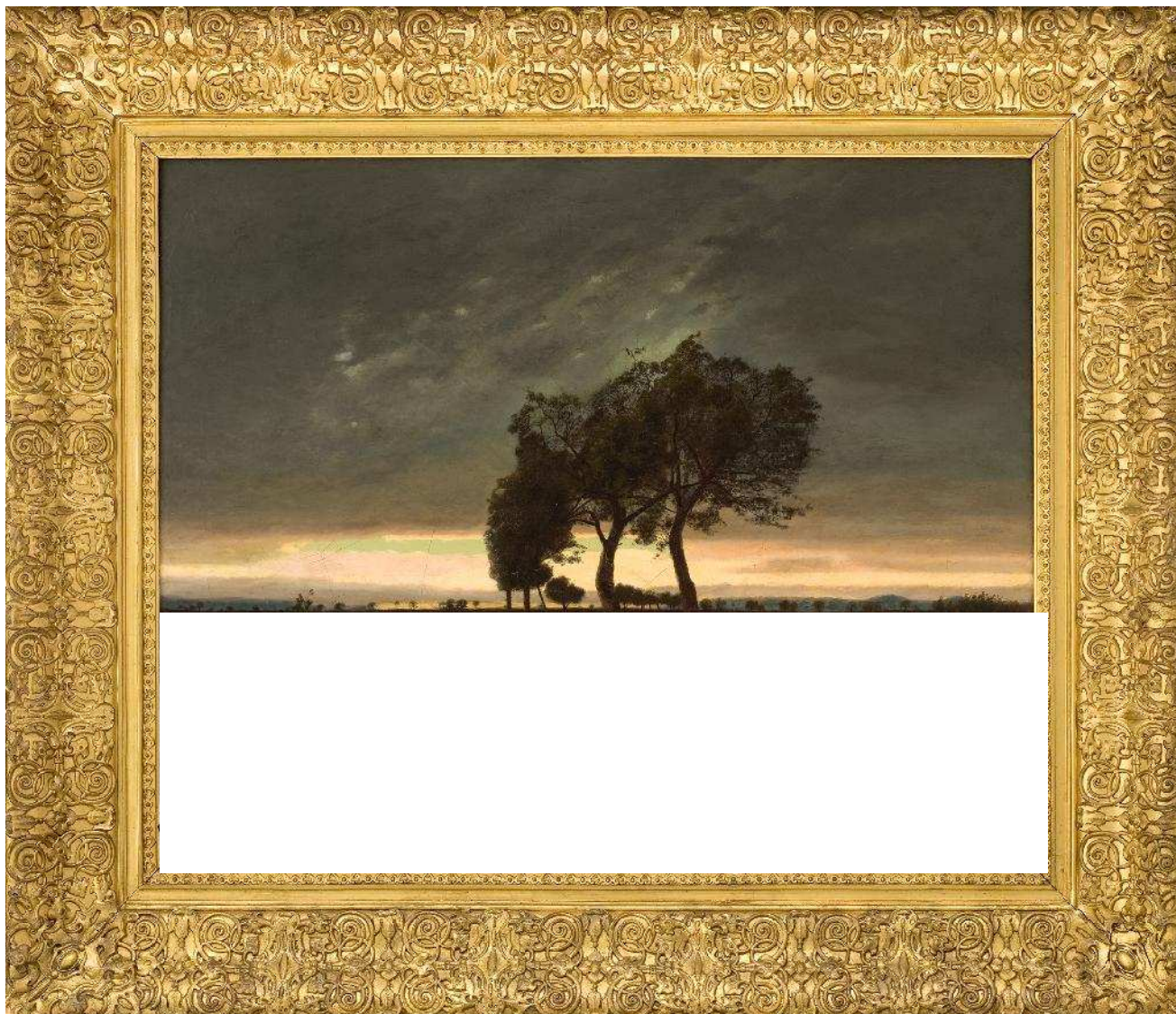
Tableau de Chintreuil à compléter