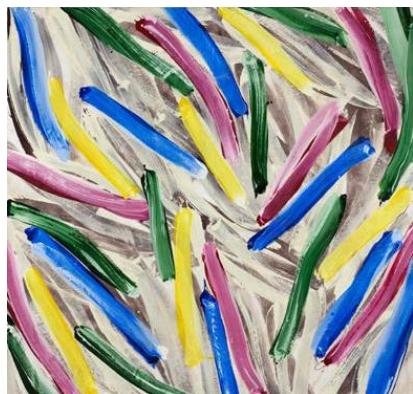
Alain Clément, Sans titre , 1982, Acrylique sur toile, 300 x 300 cm. © Adagp, Paris 2021. Don de l'artiste, 2006.