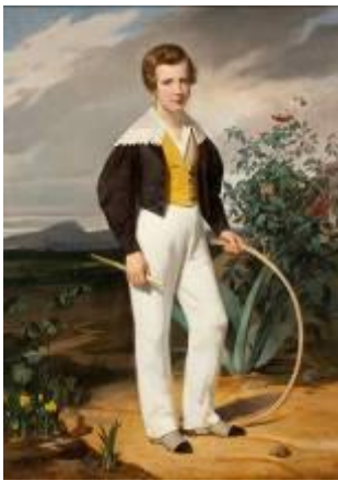
PEYSON Pierre Frédéric, Portrait d'Edmond Rouët , 1839