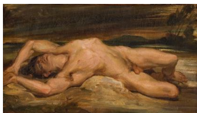
BOULANGER Louis, Mazepa, vers 1827