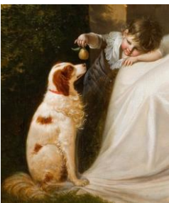
GAUFFIER Louis, (Détail)