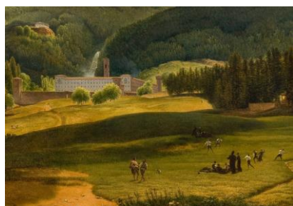
GAUFFIER Louis, La Vue de Vallombreuse, abbaye des Apennins (Détail)