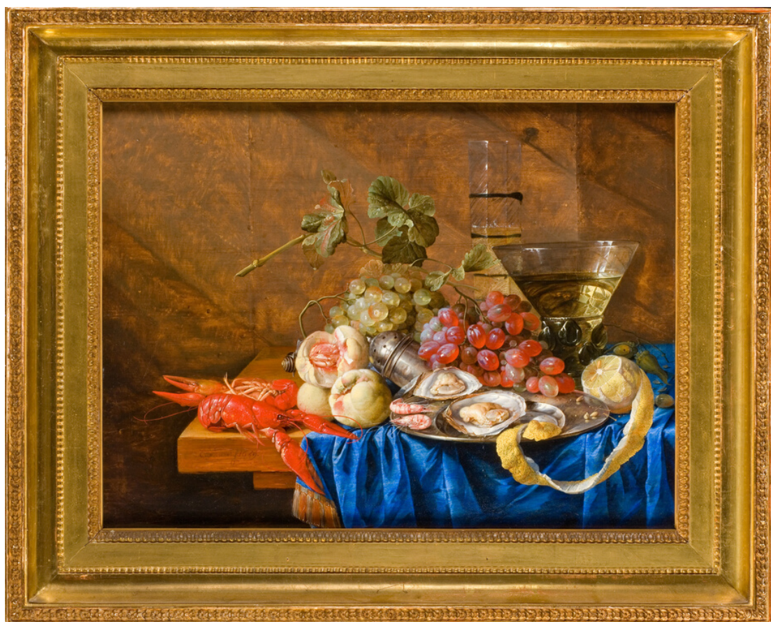
HEEM Cornelis de, "Nature morte de fruits et de fruits de mer", 1659, huile sur bois

VOICI DES EXEMPLES DE NATURE MORTE DU MUSÉE FABRE :