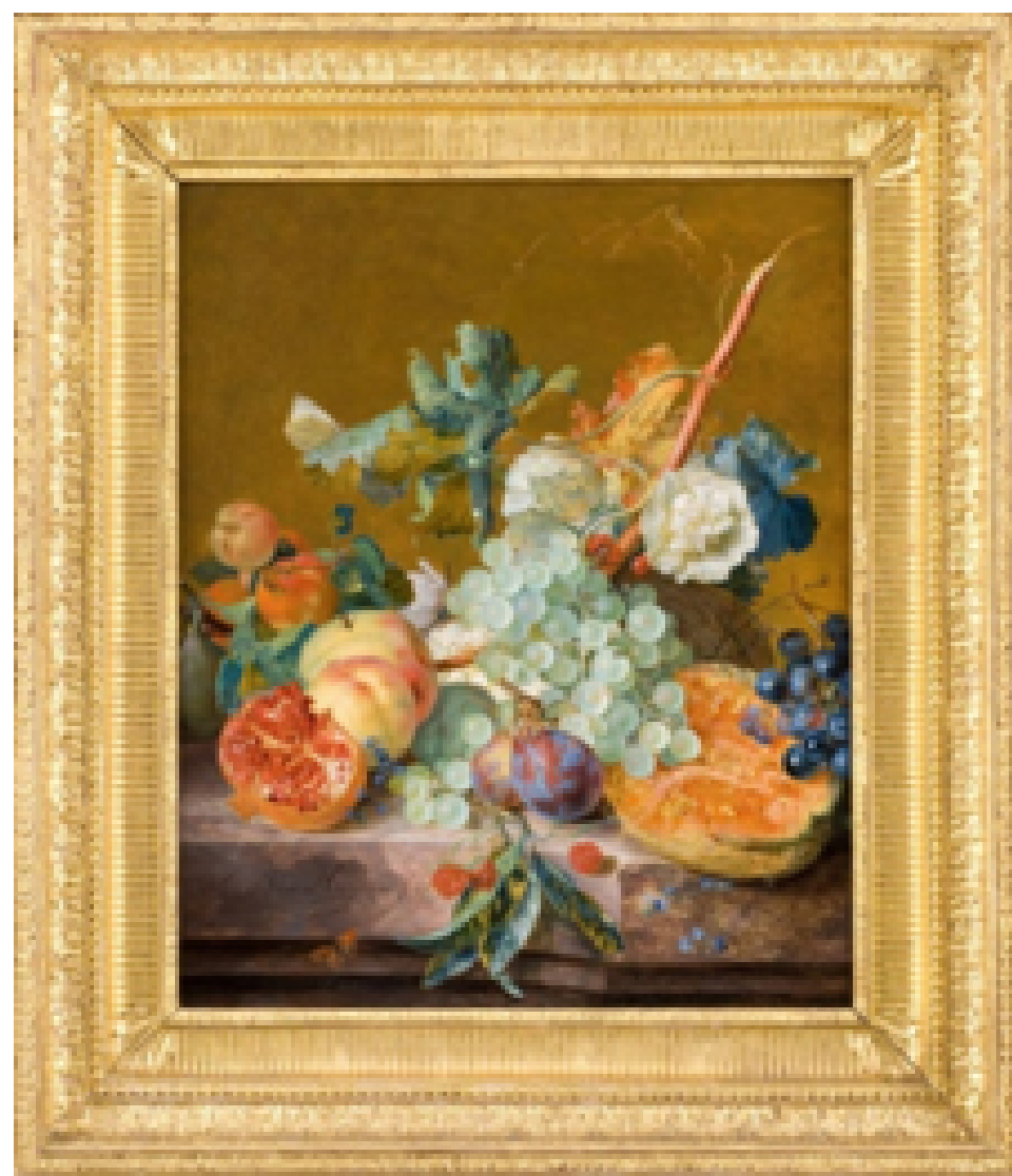
HUYSUM Jan van, "Nature morte aux fruits", Vers 1730 – 1740, Huile sur cuivre