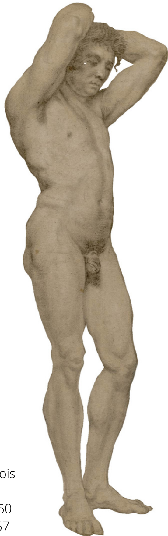
Modèles dessinés par François Xavier Fabre Académie homme, inv.39.350 Académie femme, inv.39.357