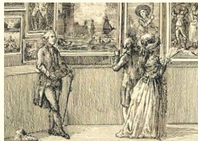
Pietro Antonio Martini, Vue du Salon du Louvre de 1785 (Détail), 1785, gravure, A. Hyatt Mayor Purchase Fund, Marjorie Phelps Starr Bequest, 2009, New-York, Metropolitan Museum of Art.

L'intégralité des œuvres connues présentées aux Salons de la Société des beaux-arts de Montpellier est recensée dans le catalogue de l'exposition.