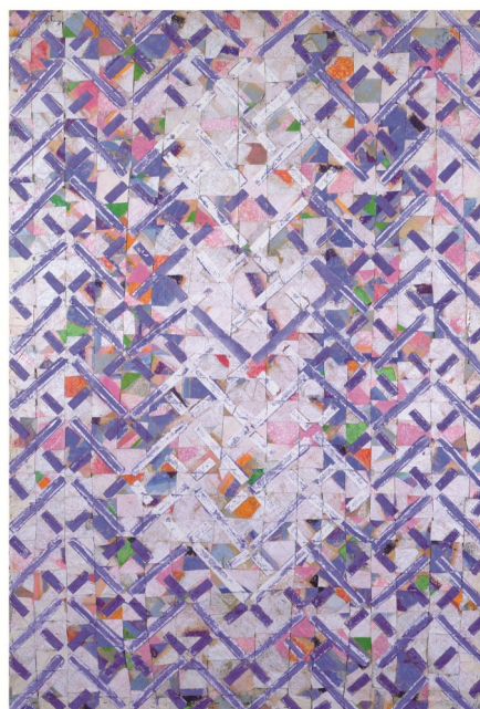
Tressage bleu et rose 1966-1967