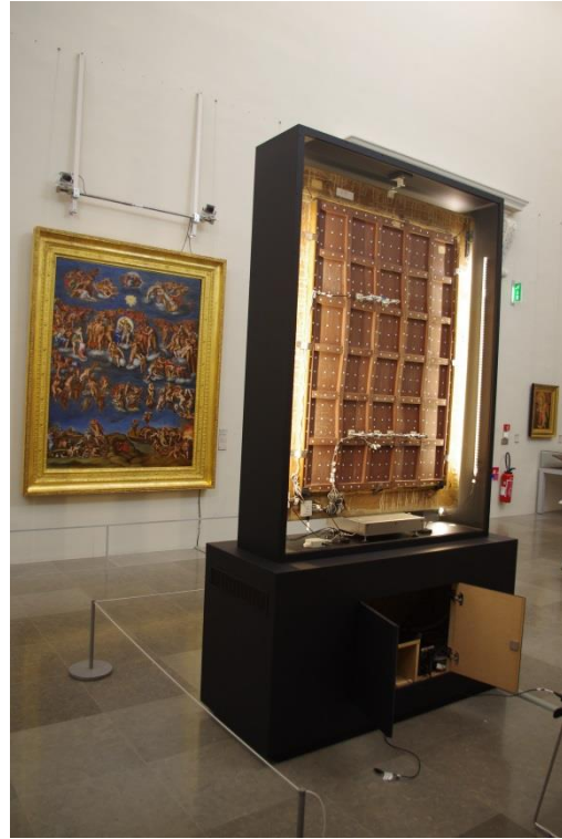
L'œuvre « équipée » est installée dans une chambre climatique, posée sur une balance qui permet de mesurer les variations de masse, se trouvant dans la salle du Jeu de Paume.

La restauration des œuvres d'art est une pratique au carrefour de l'art et de la science.